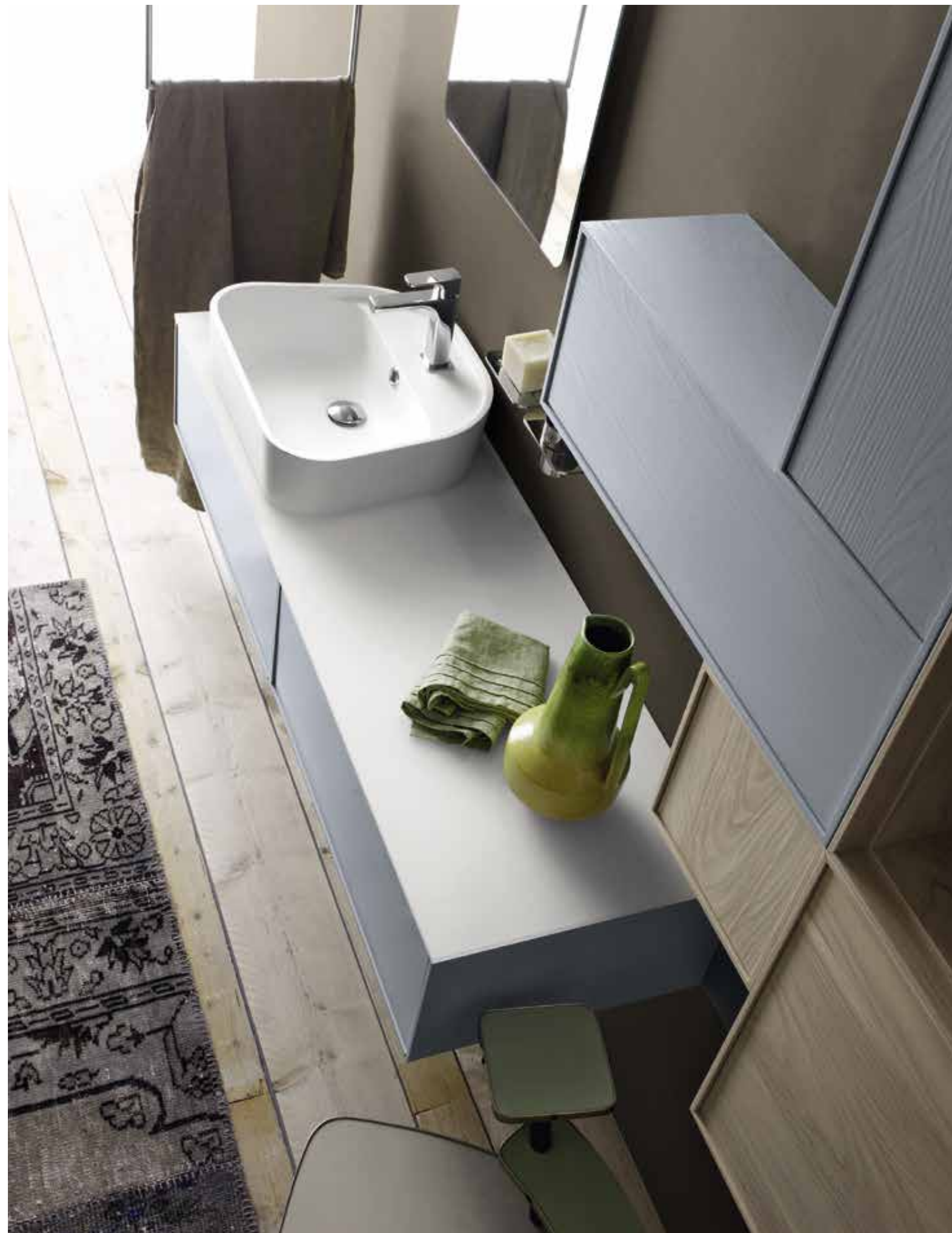
IL LAVANDINO IN MARMORESINA APPOGGIATO SU DI UN PIANO IN FINITURA LEGNO O COME A LATO SU UN PIANO IN MARMORESINA. _A MARBLE RESIN BASIN STANDING ON A WOOD-FINISH TOP OR, AS SHOWN ON THE RIGHT, ON A MARBLE RESIN ONE. _ LA VASQUE EN MARBRE DE SYNTHÈSE POSANT SUR UN PLAN DE TOILETTE FINITION BOIS OU, COMME LE MONTRE LA PHOTO CI-CONTRE, SUR UN PLAN DE TOILETTE EN MARBRE DE SYNTHÈSE. _ DER WASCHTISCH LIEGT AUF EINE PLATTE IN HOLZAUSFÜHRUNG ODER WIE AUF DER SEITE AUF EINER PLATTE AUS MARMORHARZ AUF _ EL LAVABO DE MÁRMOL SINTÉTICO DESCANSA SOBRE UNA ENCIMERA ACABADA EN MADERA O, COMO EN LA FIGURA DE AL LADO, SOBRE UNA DE MÁRMOL SINTÉTICO.