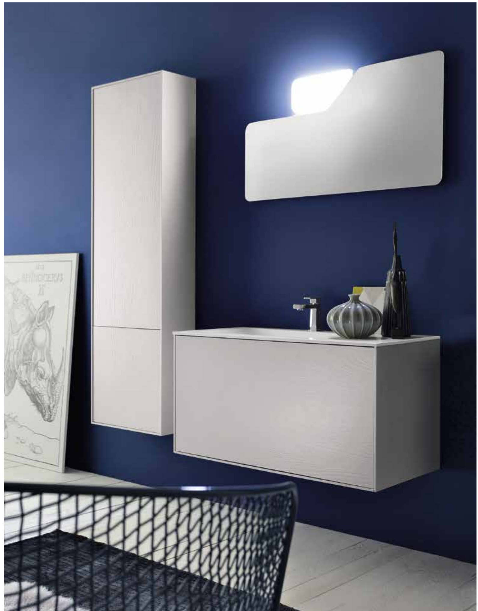
FINITURE: COLORE PLATINO OPACO COMPOSIZIONE CON LAVABO VASCA INTEGRATA IN MARMORESINA BIANCO OPACO L. 95 – COLONNA L. 50 _FINISHES: MAT PLATINO COLOURED COMPOSITION WITH INTEGRATED BASIN IN MAT WHITE MARBLE RESIN W. 95 – TALL UNIT W. 50 _ FINITION: LAQUÉ PLATINO MAT COMPOSITION AVEC VASQUE INTÉGRÉE EN MARBRE DE SYNTHÈSE BLANC MAT L. 95 – COLONNE L. 50 _ AUSFÜHRUNGEN: FARBE PLATINO MATT ZUSAMMENSTELLUNG MIT INTEGRIEREM WASCHTISCH AUS MARMORHARZ FARBE WEISS MATT B. 95 – HOCHSCHRANK B. 50 _ ACABADOS: COLOR PLATINO MATE COMPOSICIÓN CON LAVABO CON PILETA INTEGRADA DE MÁRMOL SINTÉTICO BLANCO MATE A 95 – COLUMNA A 50