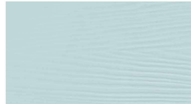
FO6 azzurro alice